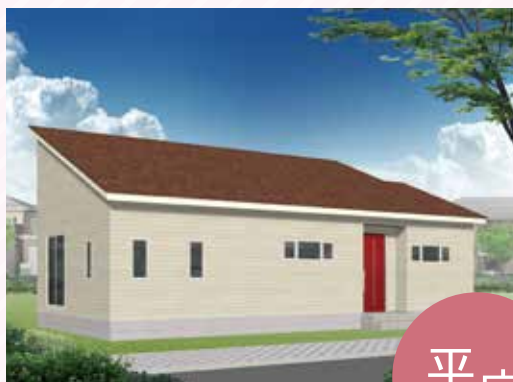
7/24 土 ・25 日 盛岡 中太田会場