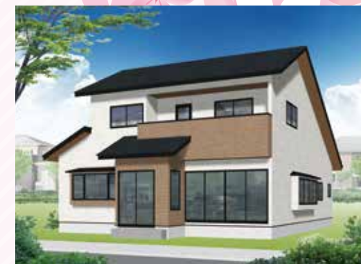
8/21 土 ・22 日 盛岡 中太田会場