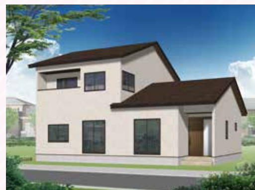
10/2 土 ・3 日 盛岡 三本柳会場