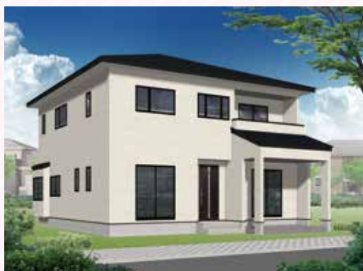
9/18 土 ・19 日 ・20 月 盛岡 中太田会場