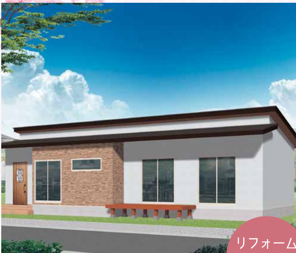
6/12 土 ・13 日 紫波会場

※日時変更の場合があります。 ※外観完成予定図は設計仕様変更で変更になる場合があります。