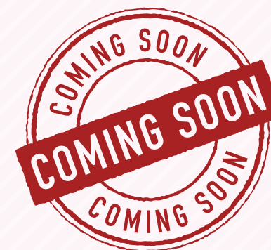
10/9 土 ・10 日 滝沢会場