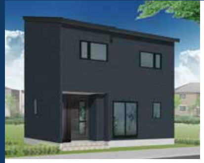
10/19(土)・20(日) 盛岡市 西見前会場

内断熱工法 ペアガラス 重厚感のある外壁、 片流れの屋根で スタイリッシュな外観に。 床や建具はライトグレージュで 統一し、シックながらも 優しい印象です。 住宅設備やクロスの色合いで アクセントを効かせた シンプルモダンの家。