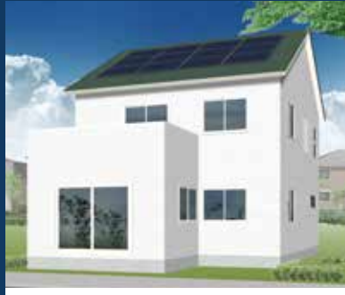
R7. 1/11(土)・12(日) 盛岡市 本宮会場

内断熱工法 ペアガラス 重厚感のある外壁、 片流れの屋根で スタイリッシュな外観に。 床や建具はライトグレージュで 統一し、シックながらも 優しい印象です。 住宅設備やクロスの色合いで アクセントを効かせた シンプルモダンの家。